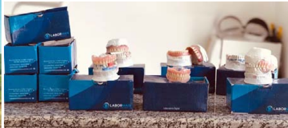
Entrega de 50 próteses dentárias para pessoas de baixa renda