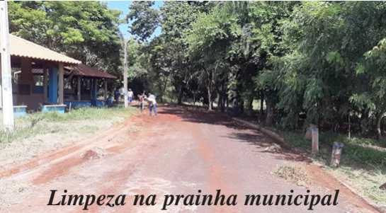
Limpeza na prainha municipal