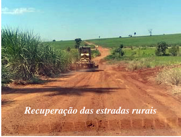
Recuperação das estradas rurais