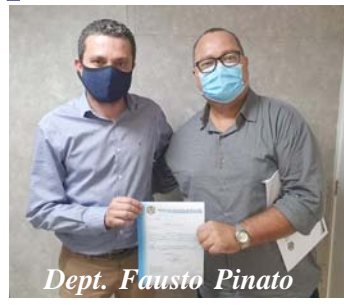
Dept. Fausto Pinato