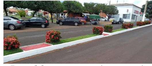
Remodelação nos canteiros centrais da cidade