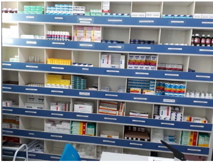
Equipamos a farmácia com mais medicamentos para atender nossa população