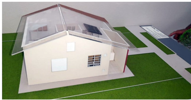
Pedido de casas populares para Riolândia junto a CDHU