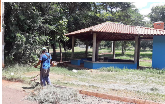
Limpeza na prainha municipal