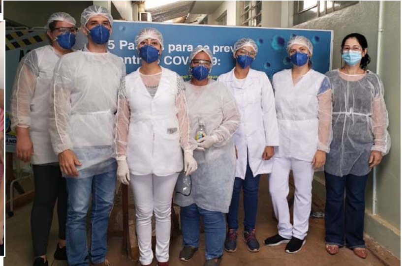
Equipe de atendimento especializado ao COVID-19