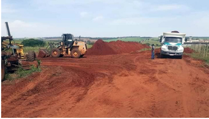
Aterro Sanitário que estava desativado, agora legalizado para uso do município