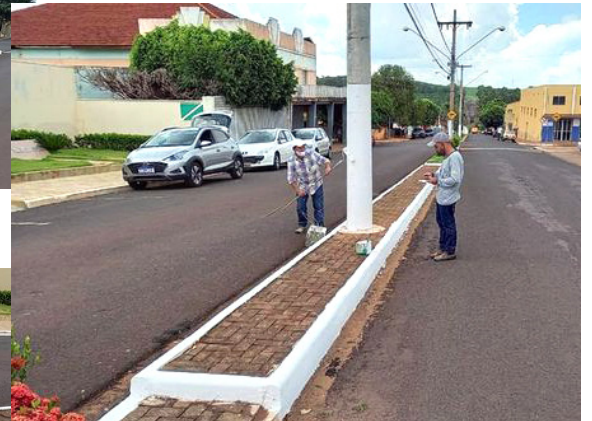
Remodelação nos canteiros centrais da cidade