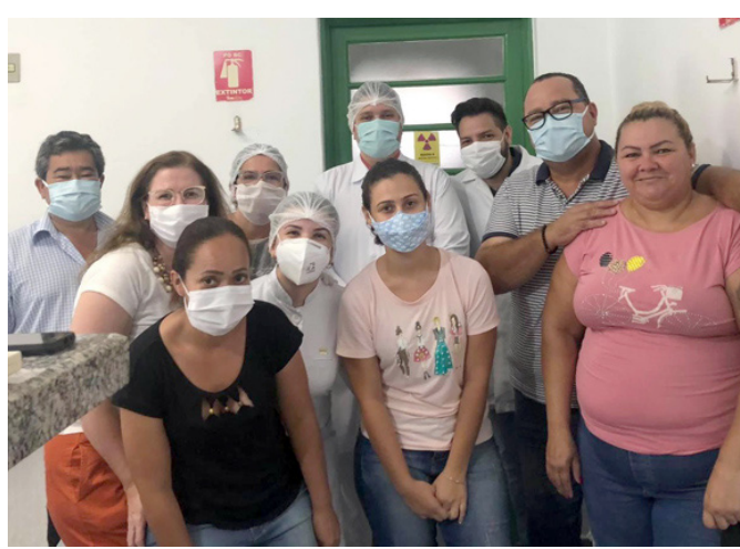
Equipe da Saúde Bucal