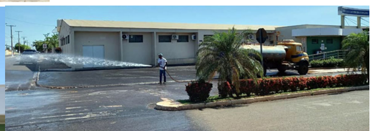
Desinfecção de calçamentos em prédios públicos municipais