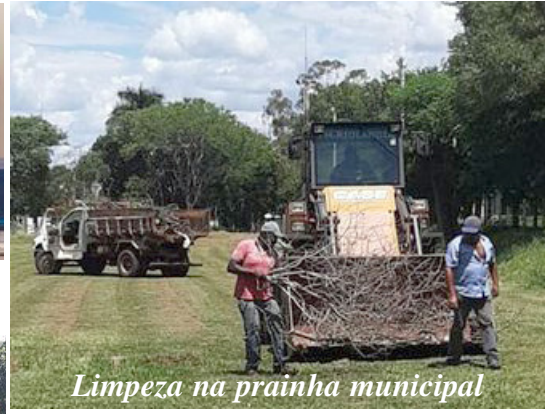
Limpeza na prainha municipal