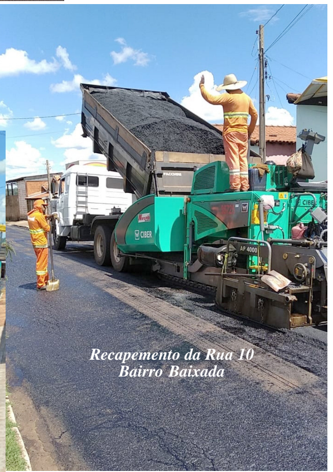
Recapamento da Rua 10 Bairro Baixada