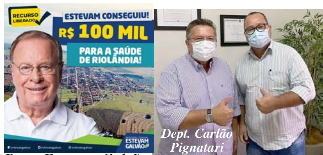
Dept. Estevam Galvão

Trabalhando e administrando com responsabilidade os recursos municipais