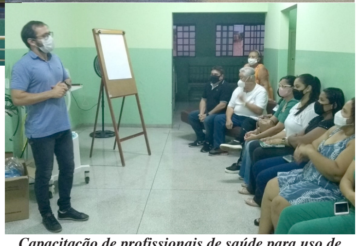
Capacitação de profissionais de saúde para uso de Ventilação Mecânica