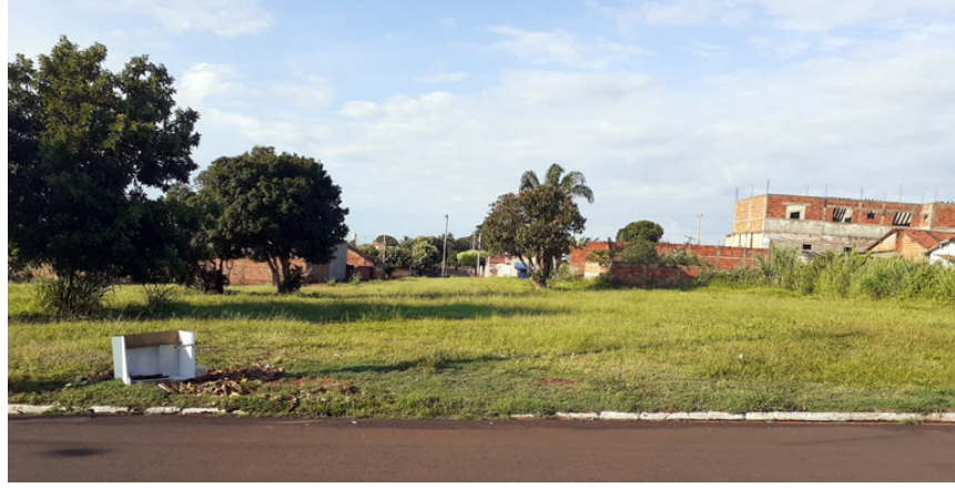
Aquisição de um terreno com recursos próprio no Bairro Baixada para construção de um novo Centro de Saúde