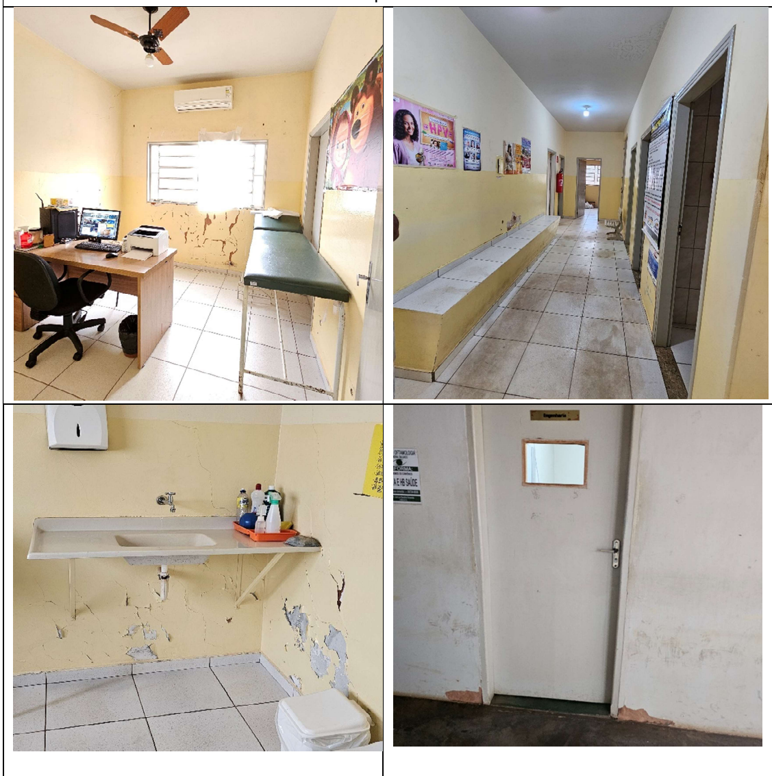
PAS localizado no Distrito de São Luis de Japiúba

Na visita de fechamento, constatamos que a UBS Central João Rodrigues Moreira está passando por reformas; contudo, no PAS Distrito de São Luis de Japiúba e na UBS José Rodrigues de Mendonça a situação permanece inalterada, conforme fotos abaixo e relatório fotográfico completo juntado (doc. 21):